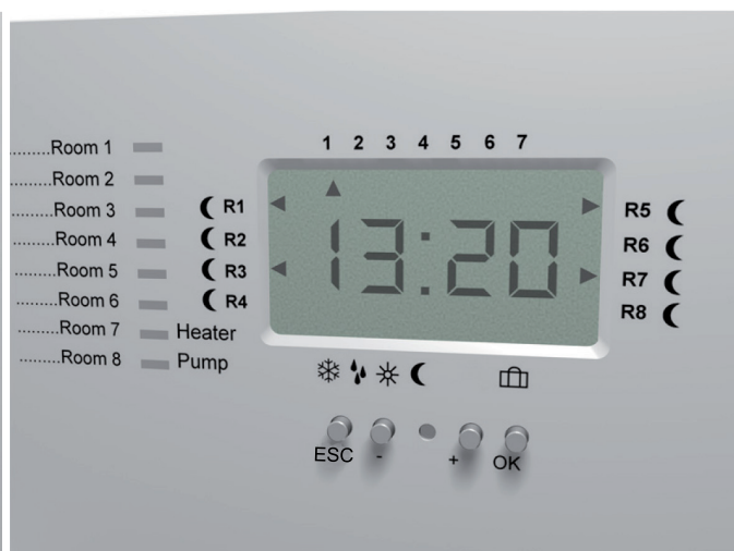
Cq 8 N - Utan ikon för Party-läge och ESC-knapp