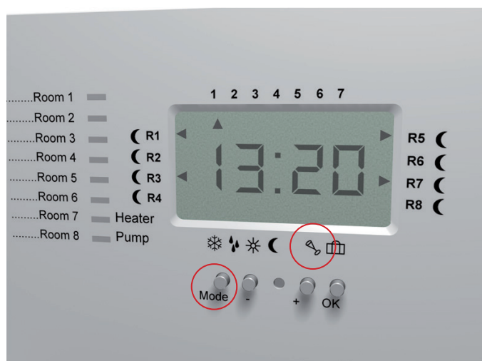
Cq 8 - Med ikon för Party-läge och Mode-knapp