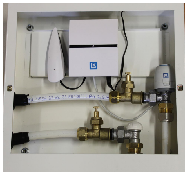
Bild 3. Anslutning mot 1-Kretssats. Montaget är här placerat i LK Inbyggnadsskåp M5 VT-XL med täta rörgenomföringar samt utrustning för trådlös rumsreglering.