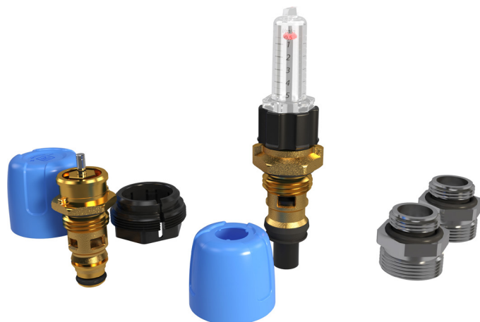
LK Ventilats VKF RF, RSK 241 02 57