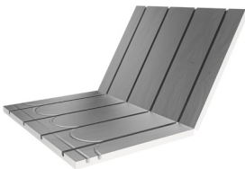
LK CombiBoard EPS 18/30/50/70

Ersätts av tre nya skivor + ny helt ny skiva LK CombiBoard EPS 18