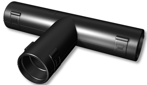
LK Liitinsuoja 34/25, Tuote nro 187 07 73