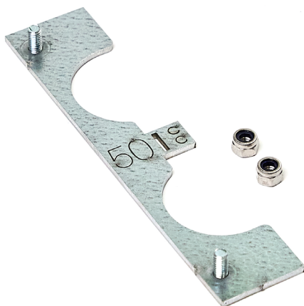
LK Radiatorfixtur Distans med två muttrar.