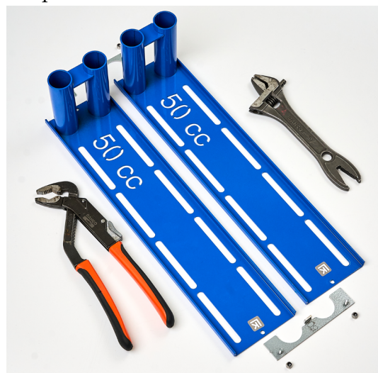
Bläcket är vänt uppåt. Verktyg ingår inte.