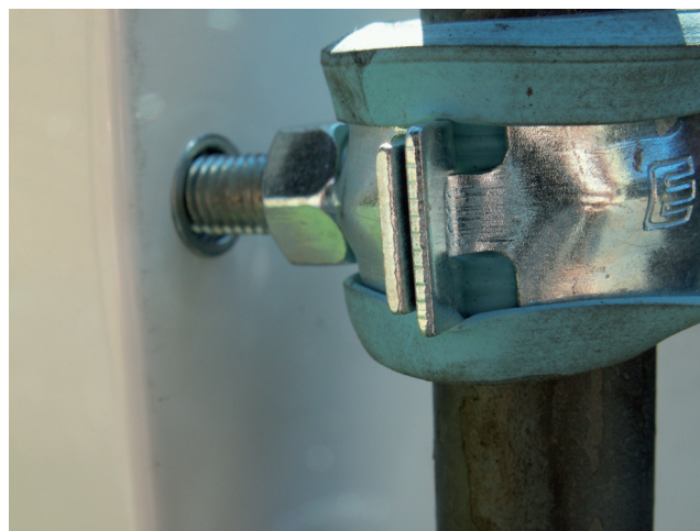
Närbild på infästning mot skåp.