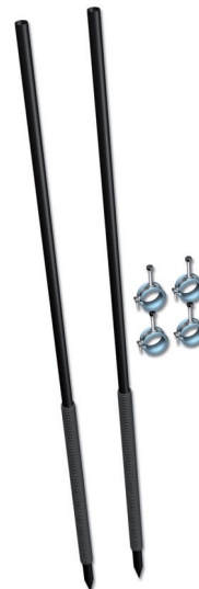
LK Skåpstaiv med infästningklammer.

Tejpa tomrören mot stativens ben för att förhind-ra att tomrören flyter upp i samband med gjut-ning.