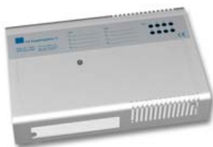
LK Kopplingsbox V.

LK Kopplingsbox V bör placeras i närhet av värmekretsfordelaren för att undvika förlängning av ställdonens kablar. LK Kopplingsbox V är avsedd för max 8 st reglerzoner.