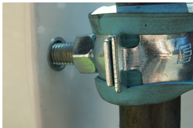
Närbild på infästning mot skåp.

Tejpa tomrören mot stativens ben för att förhindra att tomrören flyter upp i samband med gjutning.