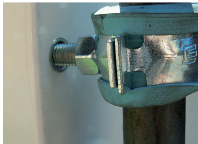
Närbild på infästning mot skåp.